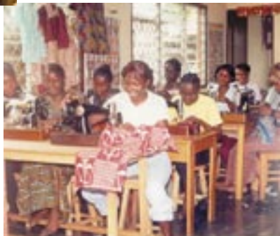
Malaki Developpement Centre de Formation en Couture des Jeunes Filles et Mères (Congo)

ont mis à ma disposition, est de race blanche et que sa voiture est truffée de divinités protectrices musindi, yoruba et consors. mais je ne pensait pas me trouver devant un grand groupement de Musundi à 98% de race blanche. Mais cela importe peu pour eux d'être Musundi Blanco (Blanc) ou Musundi Negro, ils se disent etre MUSUNDI, un point un trait. A partir du moment où ils ont passé avec succès les rites initiatiques Musundi, et qu'ils