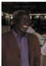
Le réalisateur malien Souleiman Sisse

Plus de 40 réalisateurs, universitaires et spécialistes du continent africain et de pays comme les États-Unis, le Brésil, l'équateur, le Panama, le Mexique, la République Dominicaine, Aruba et de la Barbade ont pris part à la rencontre.