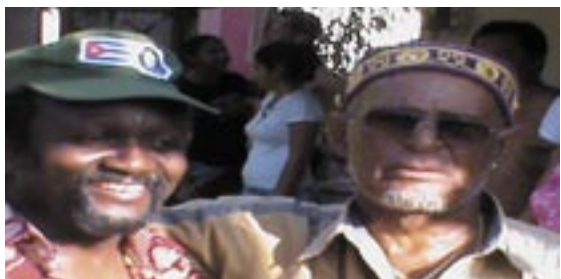
Masengo ma Mbongolo Malaki ma Kongo - Kongo

leurs futurs aéro transculturels, sous le regard approbatif des Musundi de Cuba.