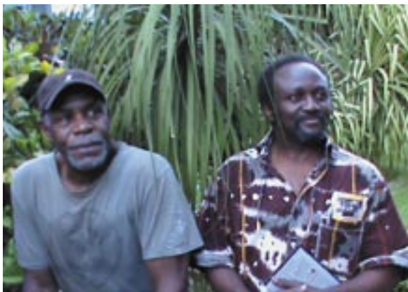
Danny Glover & Masengo ma Mbongolo

La majorité des pays africains qui accorde de l'importance au