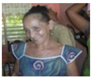
Una mama de Cuba se prépare pour le défilé made in Kongo