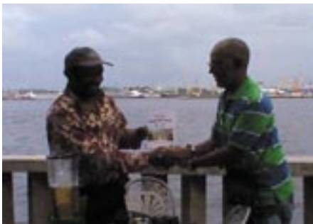
Musundi de Kongo et de Cuba

La Rencontre du Siècle entre les Musundi de Kongo et les Musundi de Cuba a honoré ses promesses, dans trois espaces culturels différents, lors des Festivités de Malaki ma Kongo à Cuba.