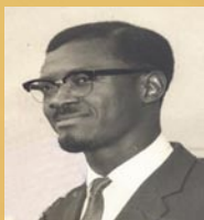
Eméry Patrice Lumumba