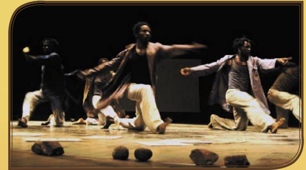
Cie Bô zu dia Katiopa de Boris Ganga Bouetoumoussa

Inscriptions à l'Atelier au Laboratoire de Percussions et danse du coeur de l'Afrique