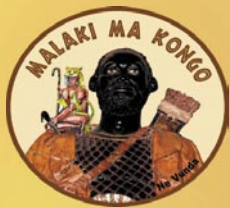
Ne Vunda Ambassadeur Kongo au Vaticano 1608

Festival International du Film Documentaire Africain pour le Développement